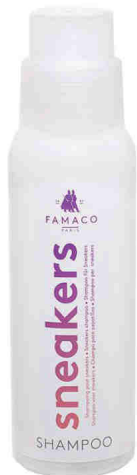
Nettoyer SHAMPOING Nettoyage cuir / textile