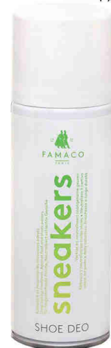
Rafraîchir SHOE DEO