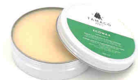
Nourrir Eco Wax Graisse à base de cires et d'huiles végétales