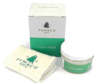
Entretenir Fama Eco crème de soin sans solvant