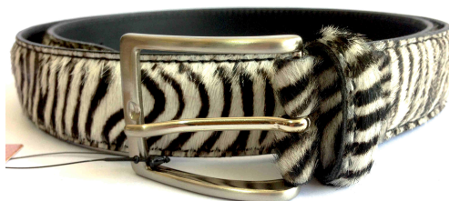
Réf : Zèbre - 35 mm