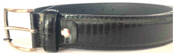
Réf : 1158 Python - 35 mm Noir