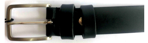
Réf : 300 - Ceinturon - 30 mm Noir