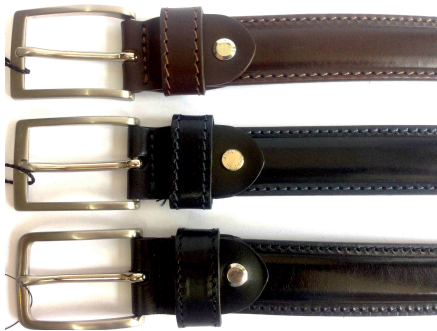
Réf : 4051 - 30 mm Noir - Marron Foncé - Bleu Marine