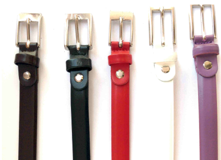
Réf : Ceinture Femme- 20 mm Noir - Marron Foncé - Rouge - Blanc - Violet