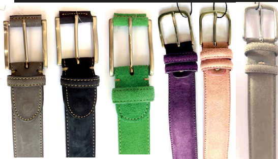
Réf : Dain - 35 mm Gris - Bleu Marine - Vert Violet - Rose - Taupe