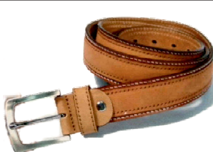
Réf : 370935 - Nubuck - 35 mm Noir - Marron Foncé - Cognac