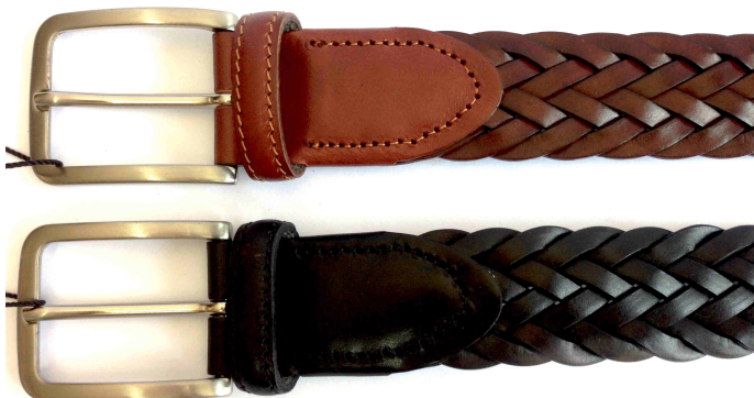
Réf : 83735 - Tressé - 35 mm Noir - Marron