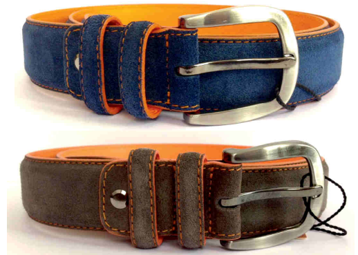
Réf : 9011 Dain verso Orange - 35 mm Bleu royal - Bleu marine - Gris