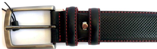
Réf : 164235 - Microperforé - 35 mm Noir - Bleu M. - Cognac / couture et verso rouge