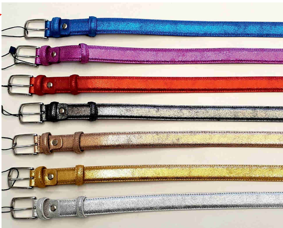
Réf : 644 - Pailleté - 25 mm Bleu - Fushia - Rouge Canon de fusil - Champagne Or - Argent