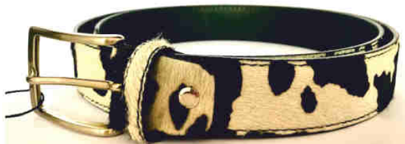
Réf : Vache - 35 mm