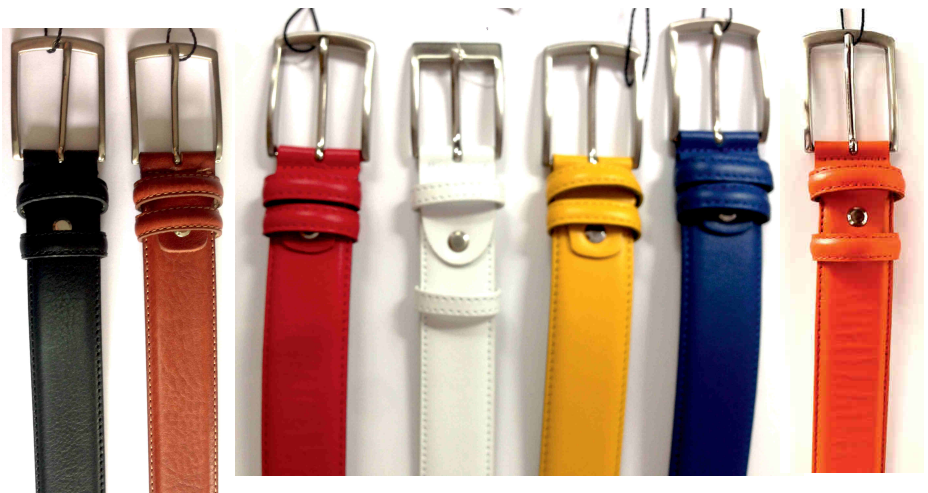
Réf : 1176 - Veau - 35 mm Noir - Cognac - Rouge - Blanc - Jaune - Bleu - Orange