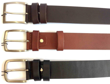
Réf : 040 - Ceinturon - 40mm long. de 110 à 130 cm Noir - Marron Foncé - Marron Moyen