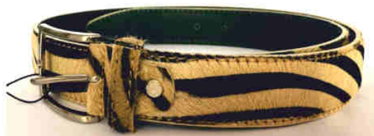
Réf : Tigre - 35 mm