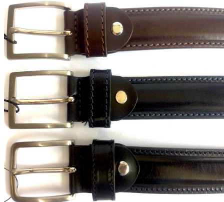
Réf : 4051 - 35 mm Noir - Marron Foncé - Bleu Marine