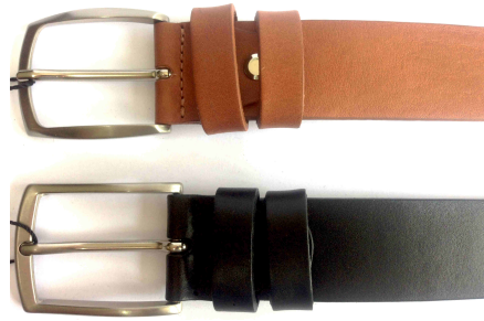
Réf : 350 - Ceinturon - 35 mm Noir - Cognac