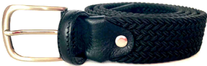
Réf : Ceinture élastique - 35 mm Noir - Bleu Marine - Rouge