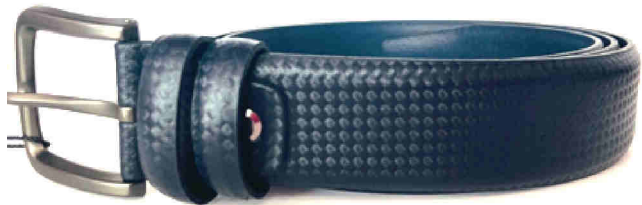
Réf : 1151 Carbone - 35 mm Noir - Bleu Marine