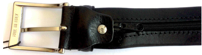
Réf : Voyageur Billet - 35 mm Noir