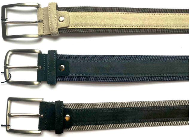
Réf : 181040 - 40 mm Cuir et Tissu Noir - Bleu Marine - Beige