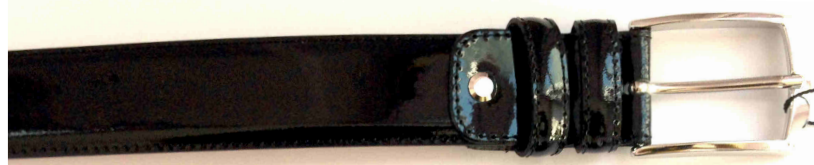
Réf : Vernis Noir - 35 mm