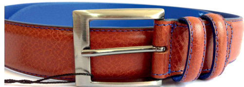
Réf : 518 - Verso bleu - 35 mm Noir - Cognac