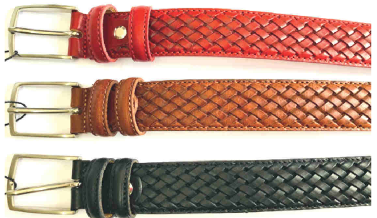
Réf : 6481 - dessin tressé - 30 mm Noir - Marron - Rouge