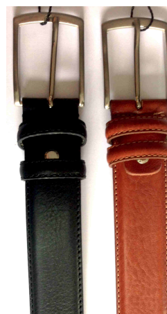
Réf : 1830 - Veau XL - 35 mm long. de 140 à 170 cm Noir - Marron Foncé - Cognac