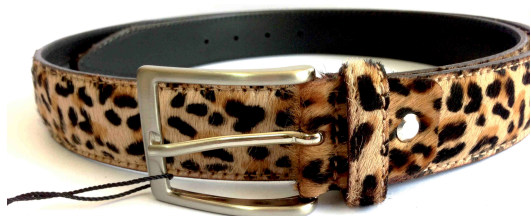
Réf : Leopard - 35 mm