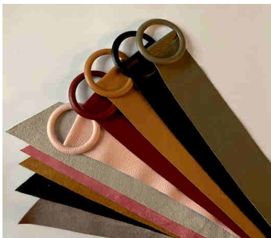
Réf : CUIR FEMME