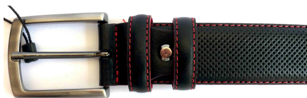
Réf : 164235 - Microperforé - 35 mm Noir - Bleu M. - Cognac / couture et verso rouge