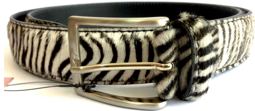
Réf : Zèbre - 35 mm