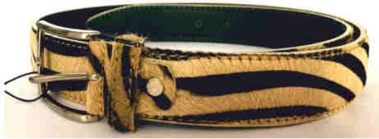
Réf : Tigre - 35 mm