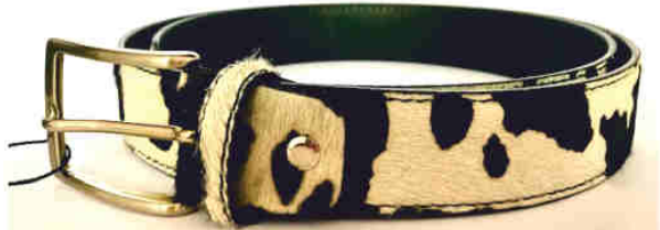
Réf : Vache - 35 mm