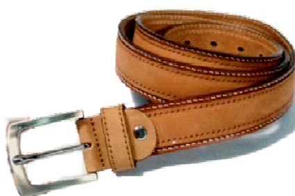
Réf : 370935 - Nubuck - 35 mm Noir - Marron Foncé - Cognac