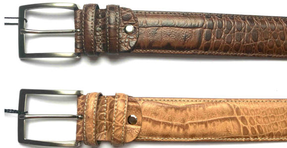
Réf : 40740 - Croco - 40 mm Noir - Bleu - Marron - Beige