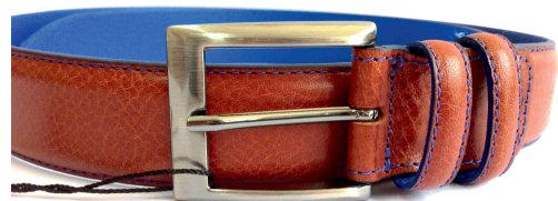
Réf : 518 - Verso bleu - 35 mm Noir - Cognac