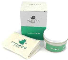
Entretenir Fama Eco crème de soin sans solvant