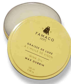
GRAISSE DE LUXE A l'huile de vison Réf. GLUXE