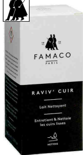
RAVIV' CUIR Lait nettoyant 100ml ou 500ml Réf : RAVIVC