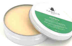
Nourrir Eco Wax Graisse à base de cires et d'huiles végétales

SANS solvant SANS gaz pour Cuir et Textile