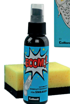
BOOM! Power cleaner pour sneakers Nettoyant basket Réf : BOOM